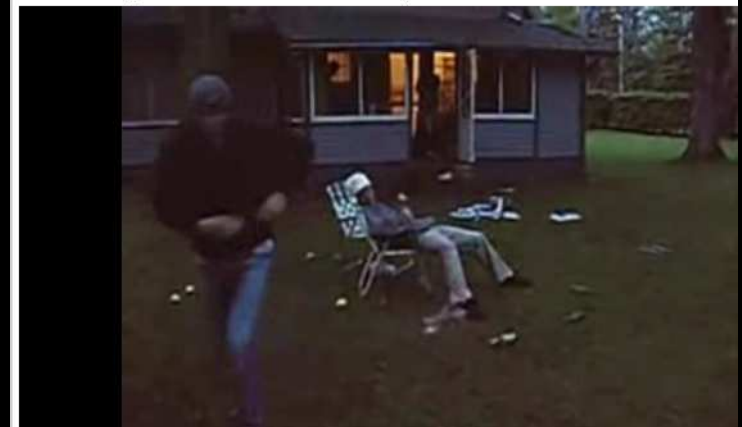
Practical joke - Firework/ wake up

http://www.youtube.com/watch?v=UESjpkUwQU