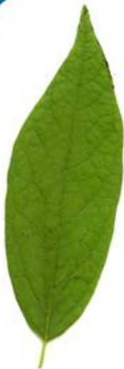
rolă simplu strat