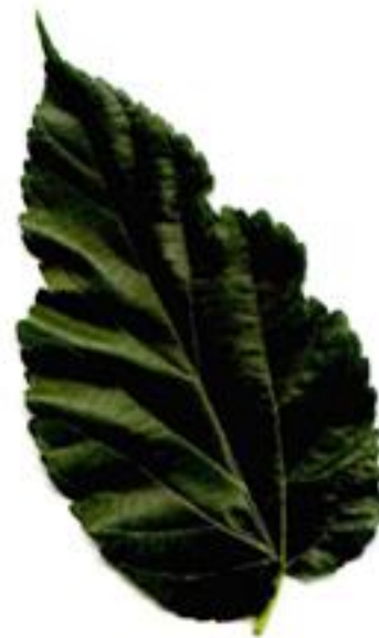
rolă jumbo extra dură