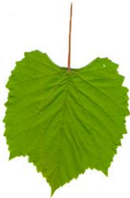
rolă jumbo dublu strat