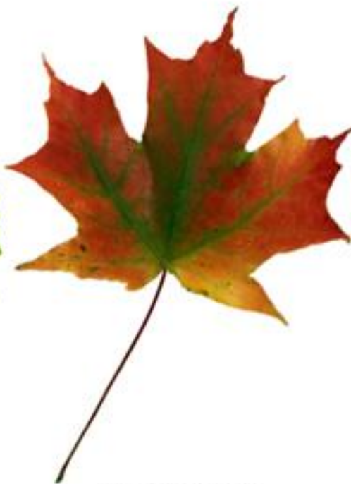
rolă premium parfumată